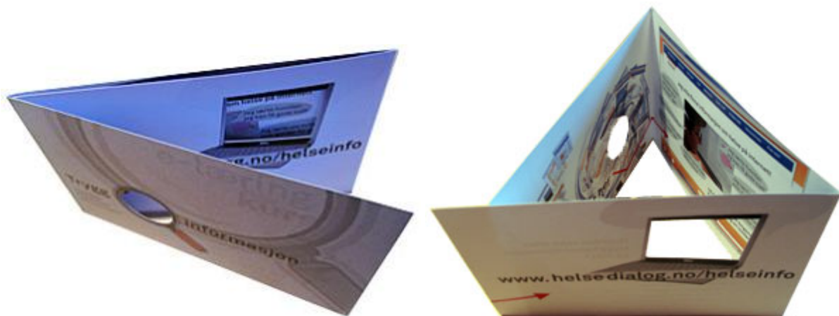
Foto over: brosjyra er utformet slik at den skal vekke nysgjerrighet. Den består av to hull og er foldet to ganger.

Kortadressen er: www.helsedialog.no/helseinfo